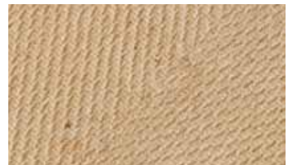
Surface d'un panneau STEICO top

En outre, les panneaux STEICO top sont ouverts à la diffusion de vapeur d'eau. Ils ne bloquent pas la migration de vapeur et l'absence de panneau structurel susceptible de bloquer également cette vapeur d'eau diminue le risque de condensation et rend la paroi plus pérenne.