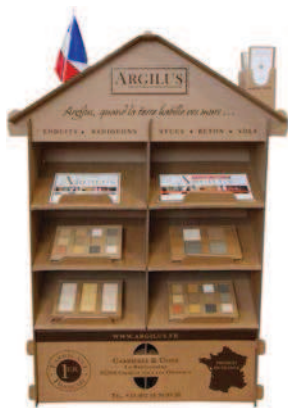
PRÉSENTOIR MAISON ARGILUS