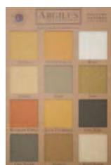
PRÉSENTOIR 12 COULEURS