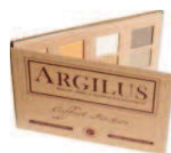
COFFRET 12 COULEURS